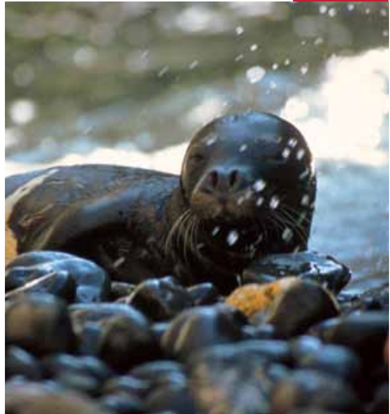
Phoque moine de Méditerranée ( Monachus monachus )

Outre ses merveilles biologiques et géographiques, la région recèle des trésors d'histoire et de culture humaine. Elle abrite des civilisations parmi les plus anciennes du monde, le plus vieil État souverain de la planète et la première république constitutionnelle, Saint Marin, qui remonte à 301 ap. J.-C. Les premières civilisations humaines (les anciennes civilisations de la Mésopotamie et de la vallée du Nil) ont commencé à occuper le bassin méditerranéen oriental à partir du 4ème millénaire av. J.-C. La mer Méditerranée est progressivement devenue le cœur de la civilisation occidentale et la route commerciale vers les richesses de l'Est jusqu'au premier millénaire ap. J.-C. et la deuxième moitié du second millénaire ap. J.-C. Les habitants de la région parlent de nombreuses langues, l'arabe étant la langue officielle la plus commune.