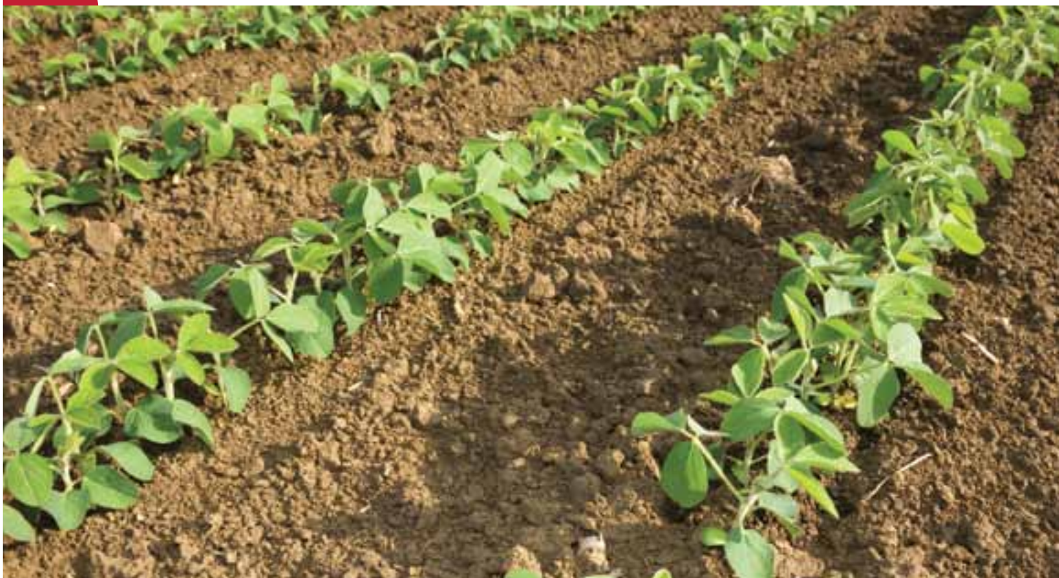
Champ de soja.

Le document présente également la stratégie d'investissement du CEPF dans la région sur une période de cinq ans. Cette stratégie comprend les opportunités de financement stratégique, appelées directions stratégiques et décomposées en priorités d'investissement, indiquant le type d'activités éligibles au financement du CEPF. Le profil d'écosystème ne décrit pas de concepts spécifiques de projets, qui ne seront développés par les groupes de la société civile que lors de leur demande de subvention auprès du CEPF.