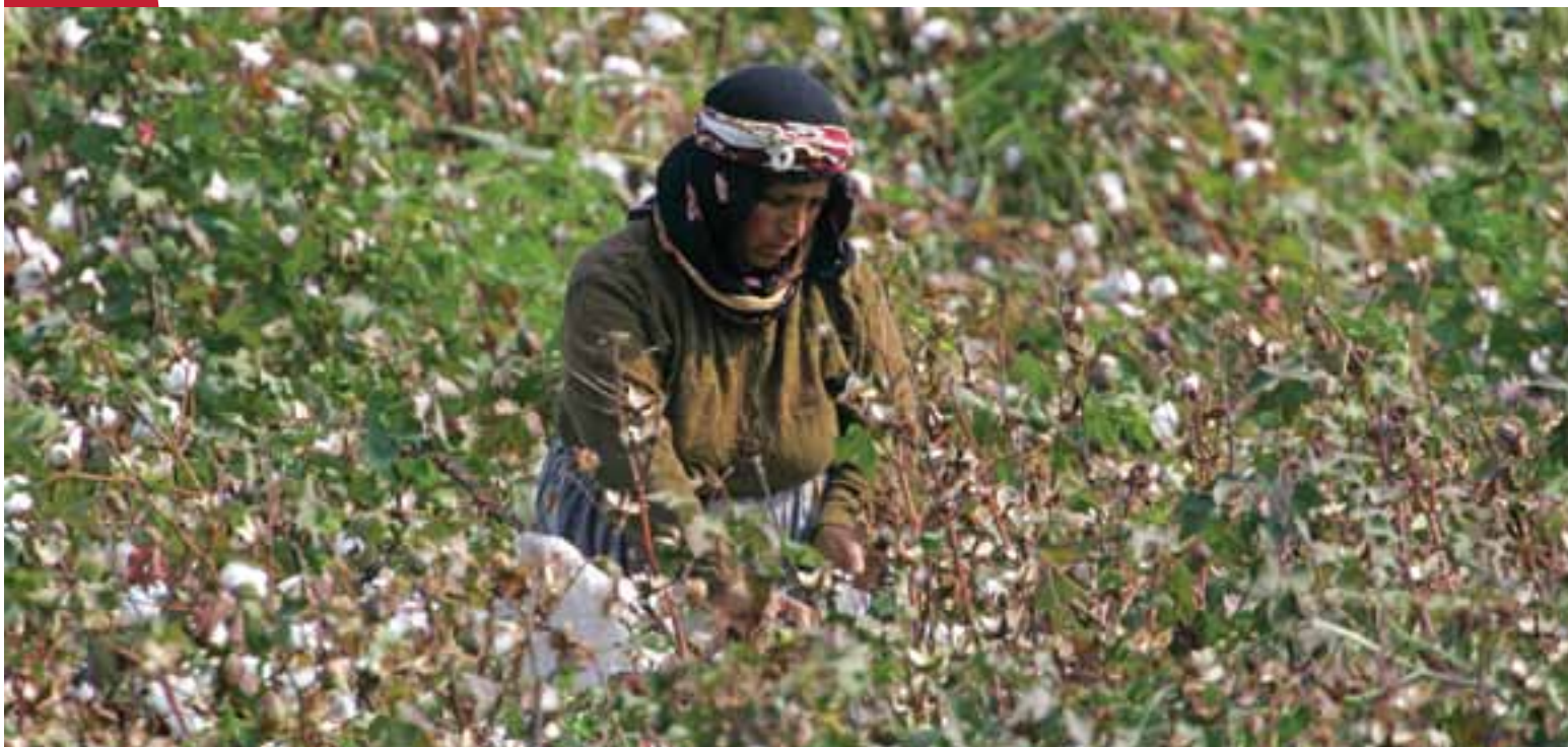
Certains bassins versants voient leurs ressources hydriques surexploitées par l'irrigation, comme ici pour la culture du coton.

La distribution géographique du financement n'est cependant pas équitable. L'Union européenne cible les pays du nord du bassin méditerranéen, notamment les territoires macaronésiens de l'UE (îles Canaries, Açores et Madère). Les autres sous-régions – le Moyen-Orient, l'Afrique du Nord et les Balkans, et le Cap-Vert – reçoivent surtout l'appui du FEM et d'autres agences multilatérales et bilatérales ciblant des pays moins développés. Ce sont également les zones prioritaires pour certaines fondations et ONG.