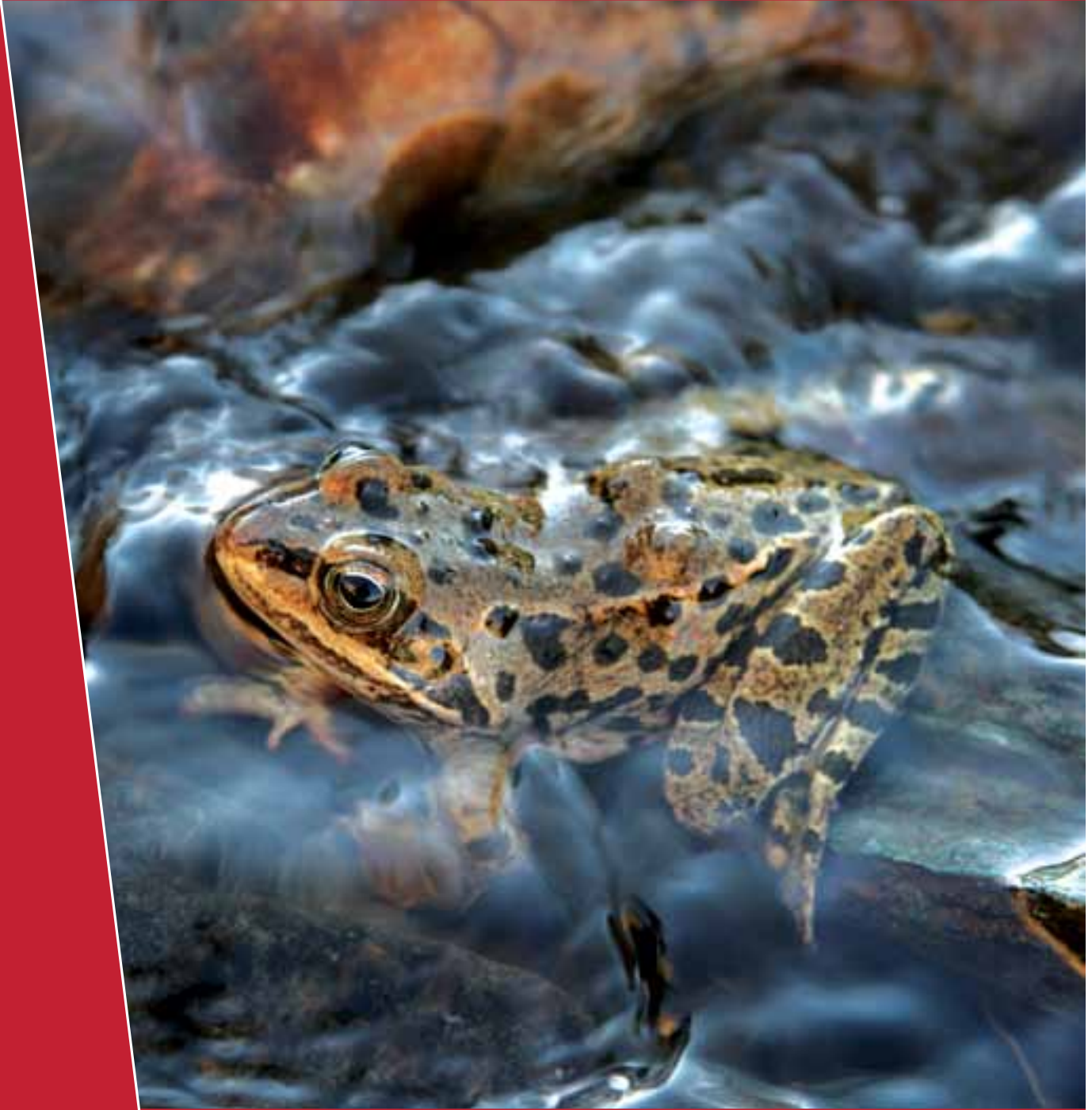
Grenouille turque ( Rana holtzi )