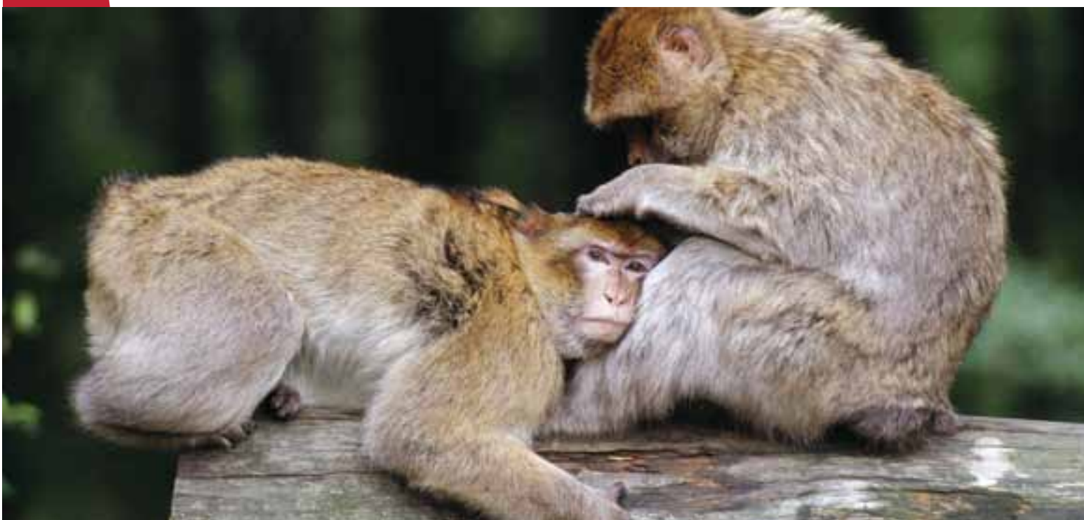
Un magot ( Macaca sylvanus ) épouille un de ces congénères. Le magot est le seul primate du bassin méditerranéen, et se rencontre encore dans quelques forêts reliques du Maroc et de l'Algérie.