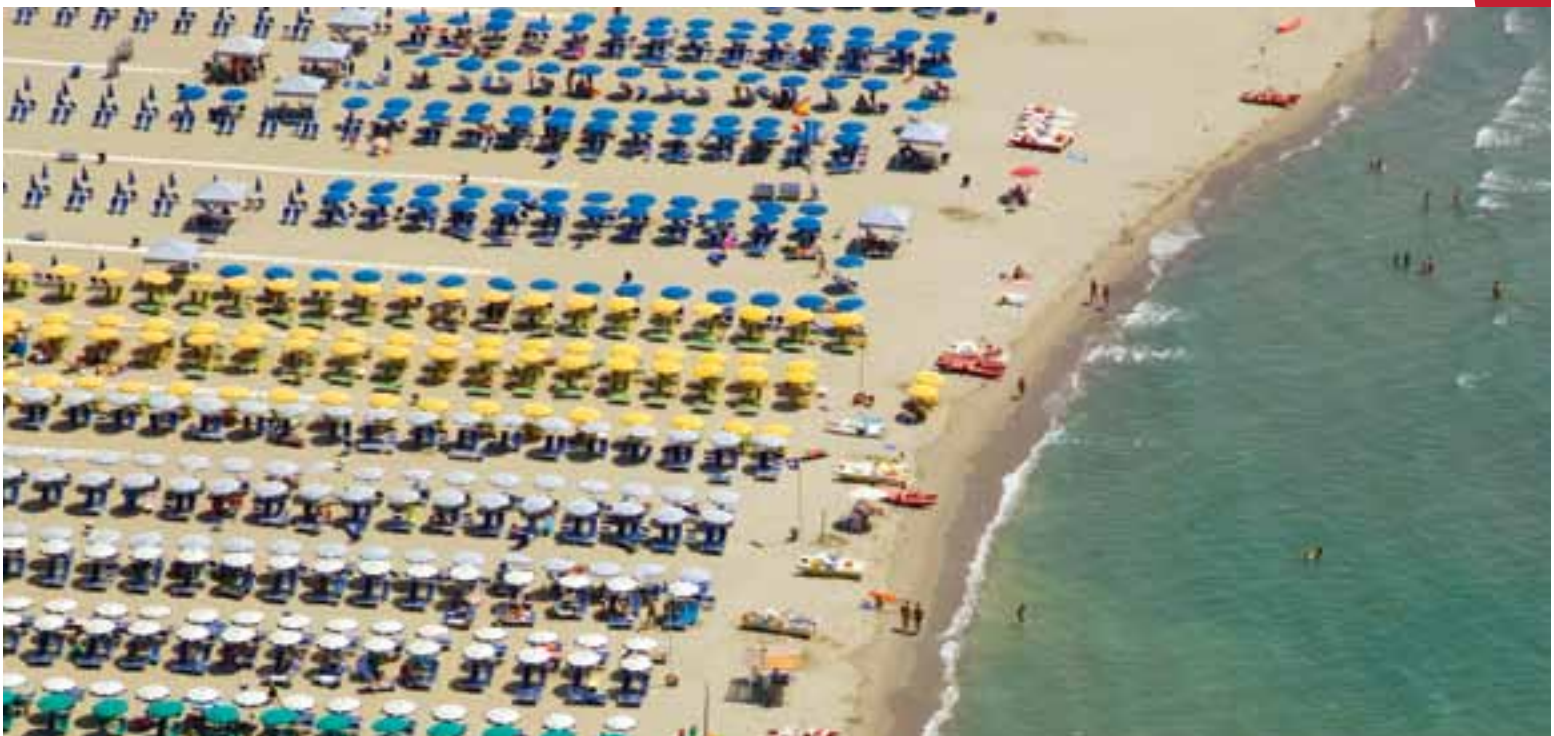
L'industrie du tourisme – ici le tourisme balnéaire en Toscane – exerce une pression croissante sur les ressources naturelles, et en particulier sur l'eau douce.

Ces prévisions de réchauffement et d'assèchement ont des implications importantes pour la conservation des biotes de la région. La fréquence des journées chaudes et sèches favorise les feux, en particulier dans le sud et l'est du bassin méditerranéen. Les changements climatiques sont aussi une source de préoccupation car l'augmentation de la demande en eau associée à la diminution du niveau de précipitations assèchera les cours d'eau, un habitat essentiel de nombreuses espèces endémiques.