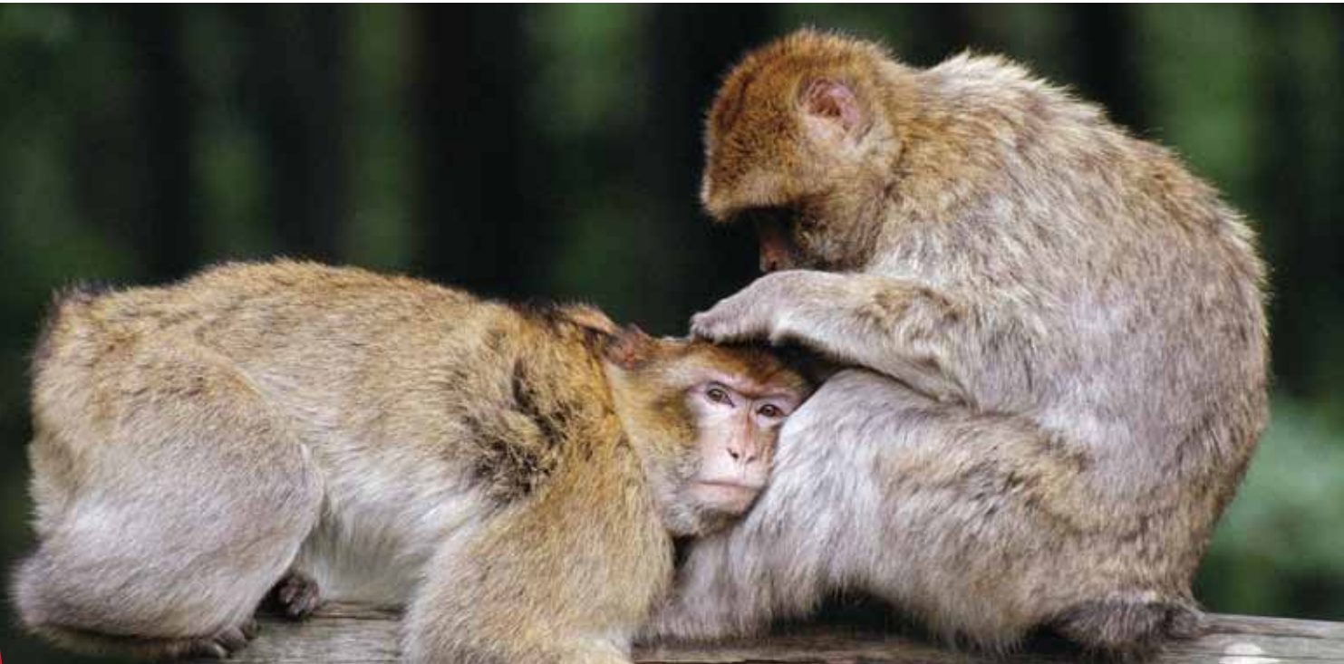
A Barbary macaque ( Macaca sylvanus ) grooms another. This is the only primate found in the Mediterranean Basin, where it is restricted to relict patches of forest and scrub in Morocco and Algeria.

تعد هذه الممرات ضرورية لحماية الروابط اللازمة لدعم حماية الأنواع المهددة بالانقراض. لا سيما فيما يتعلق بالتكيف مع تغير المناخ على المدى الطويل. فهذه الممرات هي المفتاح لضمان مرونة الأنظمة البيئية حيث يمكنها الإستمرار في تقديم الخدمات الأساسية للمجتمعات المحلية البشرية والطبيعية، وهي تعتبر الأكثر أهمية لتحقيق نتائج الحماية على المدى الطويل.