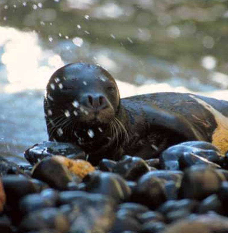
Mediterranean monk seal ( Monachus monachus )

تعد منطقة حوض البحر الأبيض المتوسط إحدى الأماكن الإستثنائية على الأرض حيث تتميز باحتوائها على نسبة تنوع حيوي عالية بالإضافة إلى احتوائها على العديد من المناظر الطبيعية الخلابة. ويعود ذلك الى وجود عدد من العوامل الرئيسية الهامة كموقعها في تقاطع اليابسة لأوراسيا وأفريقيا، وتنوعها الطبوغرافي واختلافات الإرتفاعات فيها من مستوى سطح البحر إلى 4,165 متر في الغرب (المغرب) و 3,756 متر في الشرق (تركيا).