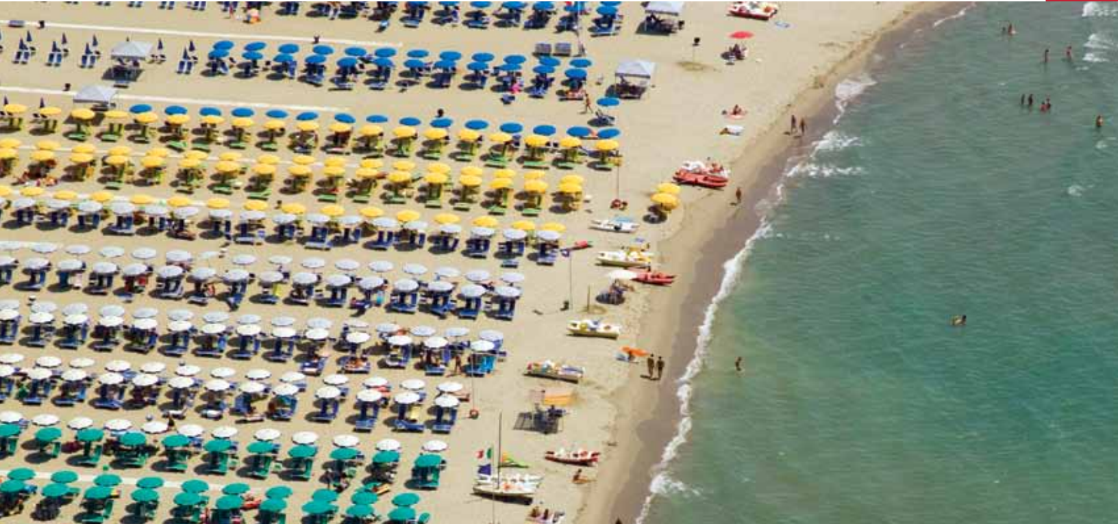
Meeting the demands of tourism, as shown in this image from Tuscany, and other industries place a significant burden on the region's natural resources, especially freshwater.

يؤثر تغير المناخ الناشئ من عوامل إنسانية على الأنظمة البيئية في حوض البحر الأبيض المتوسط. وتشير الأبحاث إلى أن تغير المناخ سيؤدي إلى زيادة في متوسط درجات الحرارة السنوية، حيث ستزداد أيام الصيف الحارة وترتفع درجات الحرارة خاصة في الأجزاء الجنوبية والشرقية من حوض البحر. وسيرتبط هذا التغير في درجة الحرارة بتحول متوقع في هطول الأمطار السنوي، حيث من المتوقع أن ينخفض معدل هطول الأمطار السنوية بنسبة 20% إلى 30% على مدى السنوات الخمسين القادمة، وتشير التنبؤات طويلة الأجل (من 70 إلى 100 سنة) إلى حدوث جفاف عام لحوض البحر الأبيض المتوسط بأكمله. مما سيؤدي إلى عواقب وخيمة على وضع النباتات والحيوانات في المنطقة. فعلى سبيل المثال، إن تعاقب الأيام الحارة والجافة سيؤدي إلى الحرائق خصوصاً في جنوب وشرق حوض البحر الأبيض المتوسط. وبالتالي فإن هذه التغيرات المناخية ستكون مصدر قلق بحد ذاتها لأنها ستؤدي إلى زيادة الطلب على المياه بالإضافة إلى انخفاض مستوى هطول الأمطار مما يؤدي إلى جفاف الأنهر، وهي موئل تعتمد عليها العديد من الأنواع المستوطنة في المنطقة.