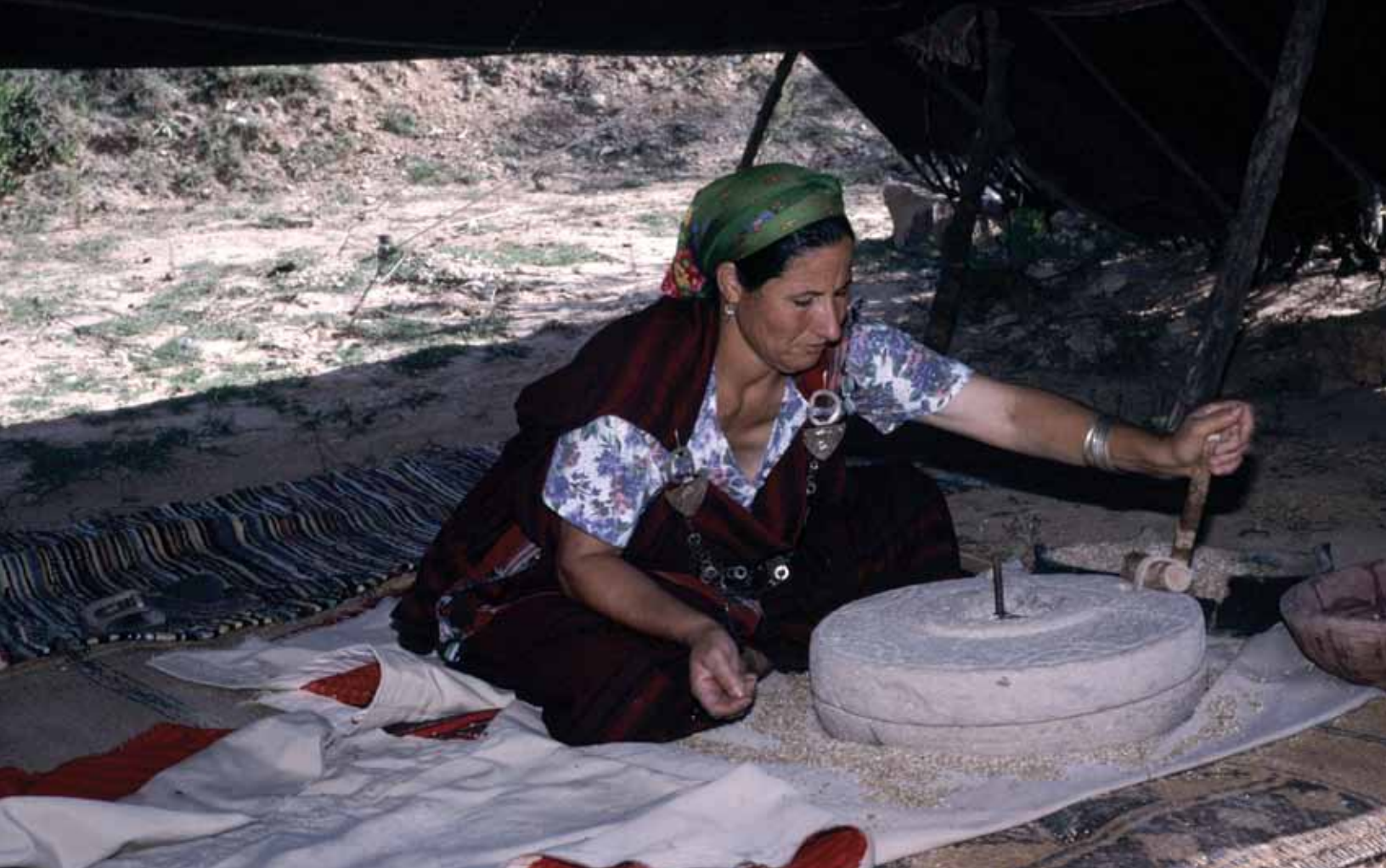
A woman mills grain by hand in Buoficha, Tunisia.

يعد هذا الملف، والذي تم تطويره من خلال مساهمة أكثر من 90 منظمة عاملة أو قائمة في المنطقة، أكثر من مجرد استراتيجية للصندوق، حيث يقدم نموذجاً لجهود الحماية المستقبلية في حوض البحر الأبيض المتوسط والتعاون بين المانحين.