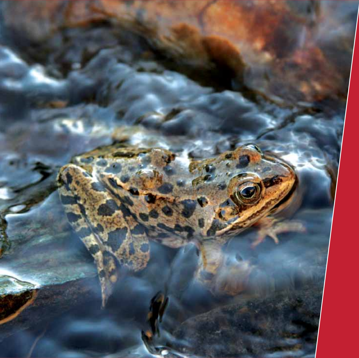
Turkish frog ( Rana holtzi )