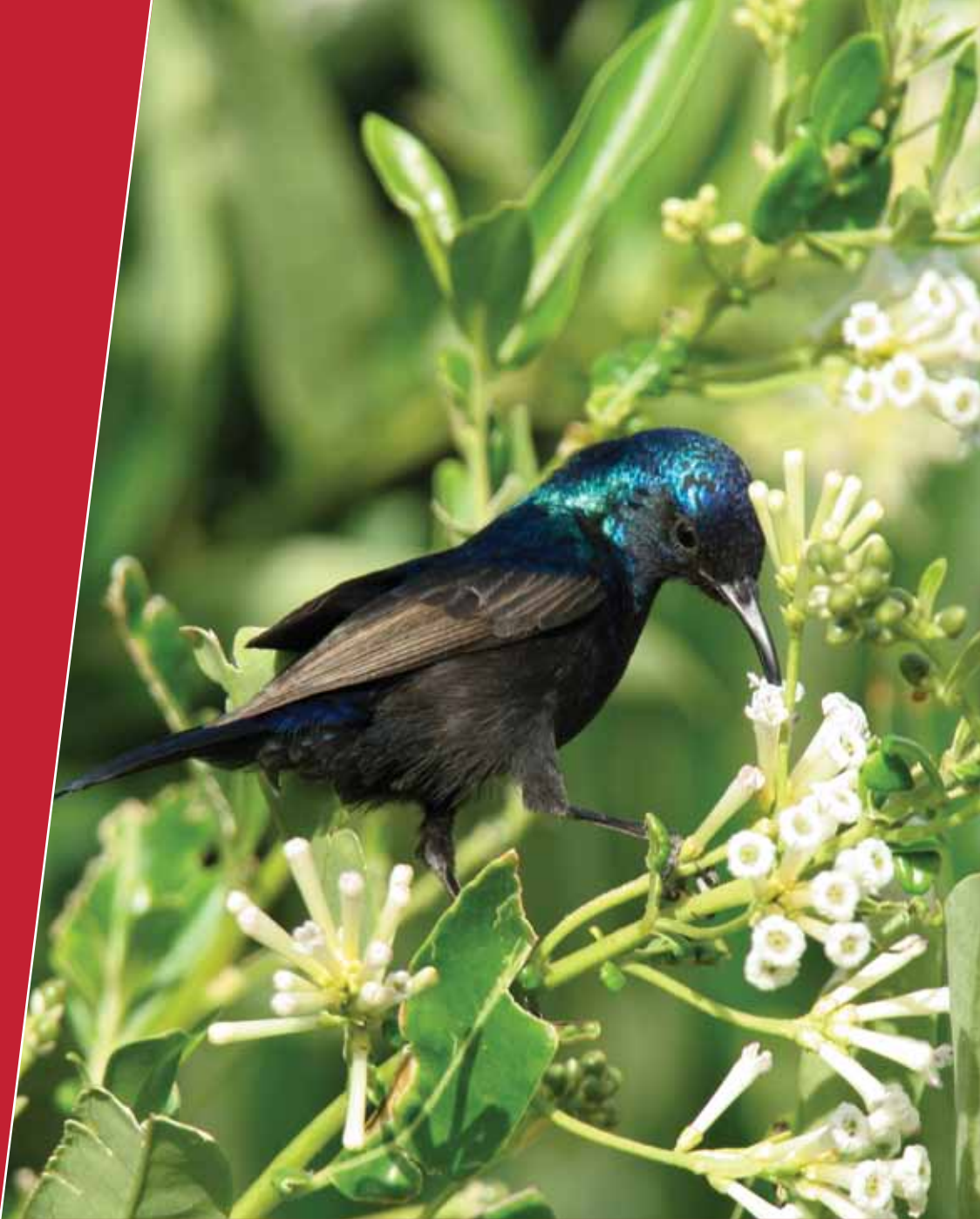
A male Palestine sunbird ( Nectarinia osea ) feeds from flowers.