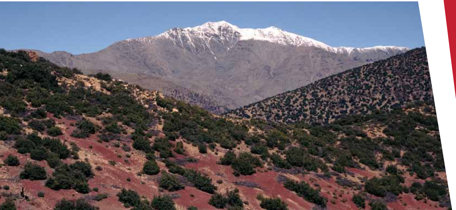
The High Atlas Mountains of Morocco

القليل من المنظمات المانحة حالياً تدعم منظمات المجتمع المدني للقيام بدور حيوي ومحوري في الحفاظ على المناطق المهمة للتنوع الحيوي و المساقط المائية التي توجد فيها هذه المناطق. حيث أن معظم هذه المناطق الهامة للتنوع الحيوي تسكنها أعداد كبيرة من الناس الذين يعتمدون على المياه والموارد الطبيعية الأخرى. إلا أن منظمات المجتمع المدني تحظى بمكانة هامة للقيام بدور ريادي في الحماية المستدامة لهذه المواقع، ومن الممكن أن تحفز الشراكة بين الحكومات وشركات القطاع الخاص نحو الحفاظ على التنوع الحيوي.