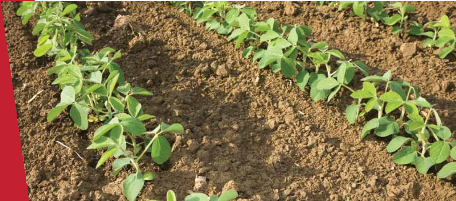
Soybean crop.

يقدم الملف التشخيصي لمحة عامة عن الحوض، بما في ذلك أهميته البيولوجية في السياق العالمي والإقليمي، وأثار تغير المناخ المحتملة والأخطار الرئيسية التي تهدد التنوع الحيوي والأسباب الجذرية لذلك، كما احتوى الملف على معلومات عن السياق الاجتماعي والإقتصادي و الإستثمارات الحالية في مجال حماية البيئة. كما ويوفر الملف مجموعة من مخرجات حماية البيئة القابلة للقياس، ويحدد الثغرات وفرص الإستثمارات في تمويل حماية البيئة، وبناءً على المعلومات السابقة تم تحديد الحيز المناسب لاستثمار صندوق شراكة الأنظمة البيئية الهامة الأمر الذي سيوفر أكبر قدر من القيمة المضافة. ويحتوي الملف على استراتيجية مدتها خمسة سنوات خاصة بالإستثمار في المنطقة، وتضم هذه الإستراتيجية الإستثمارية سلسلة من فرص التمويل الإستراتيجي تسمى التوجهات الإستراتيجية وهي مقسمة لعدد من أولويات الإستثمار التي تحدد أنواع الأنشطة التي سوف تكون مؤهلة للتمويل من قبل صندوق شراكة الأنظمة البيئية الهامة، حيث ستقوم مؤسسات المجتمع المحلي بوضع مقترحات مشاريع للحصول على تمويل من خلال الصندوق، لذا فإن الملف لا يتضمن أية مفاهيم أو مقترحات لمشاريع محددة.