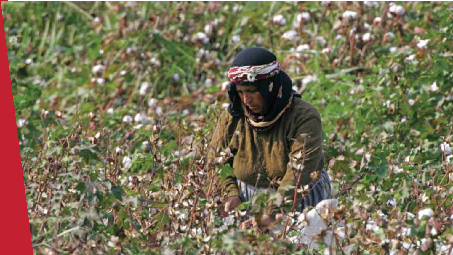
Irrigation-intensive activities, such as cotton farming, drain the basin's freshwater systems.

غير أن التوزيع الجغرافي للتمويل غير متساوي في المنطقة حيث يستهدف تمويل الإتحاد الأوروبي البلدان الشمالية في حوض البحر الأبيض المتوسط، بما في ذلك الأراضي التي تقع في الإتحاد الأوروبي (جزر الكناري، ماديرا وجزر الأزور). أما المناطق الفرعية الأخرى كالشرق الأوسط وشمال أفريقيا ودول البلقان والرأس الأخضر (كاب فيردي) فتلقى معظم الدعم من مرفق البيئة العالمي والمنظمات الأخرى المتعددة الأطراف والمنظمات الثنائية حيث تركز على البلدان الأقل نمواً. وتشكل هذه المناطق أيضاً مجالات ذات أولوية لبعض المنظمات.