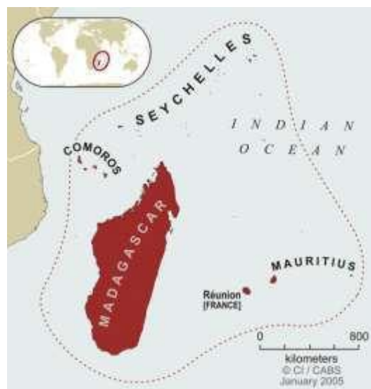
Sary 0-1: Topi-maso ny «Hotspot»

Nampiasa vola ho an'i faritr'i Madagasikara tafiditra ao an'inty «Hotspot» ny CEPF tamin'ny taona 2000, dimy taona ny dingana hampiasana ny vola (2001-2006, 4,25 tapitrisa $), hampiana telo taona ho fanamafisana ny dingana (2009-2012, 1,4 tapitrisa $). Tamin'ny Desambra 2012 no nosokajian'ny Filan-kevitra ny Mpamatsy Volan'ny CEPF ho azo fidiana amin'ny dingana vaovao amin'ny fanampiana ara-bola ny faritry ny «Hotspot» eto Madagasikara sy ny Nosy ao amin'ny Ranomasim-be Indiana. Momba ny fampiasam-bola ho avy, dia mila fantarina ny toetoetry ny zava-misy ao amin'ny faritry ny «Hotspot» izay vao mamaritra ny laharam-pahamehana sy ny asa ho hatao.